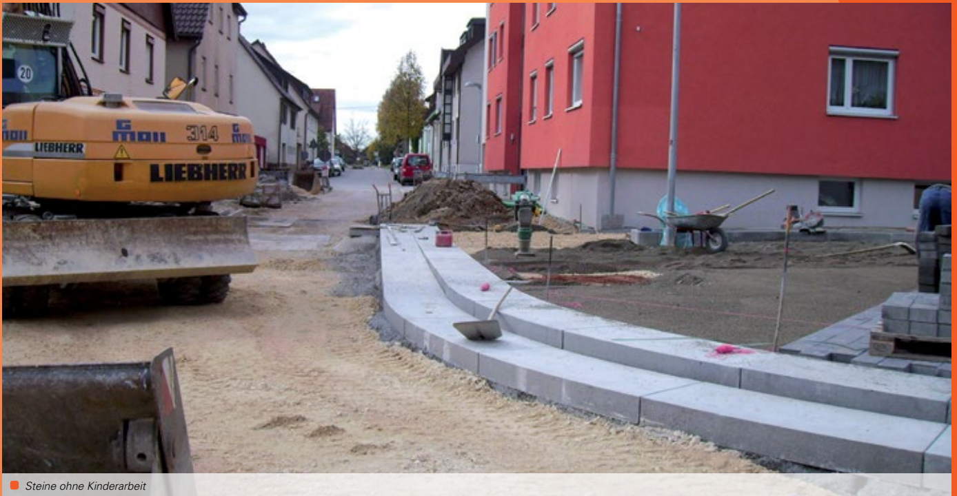
Steine ohne Kinderarbeit