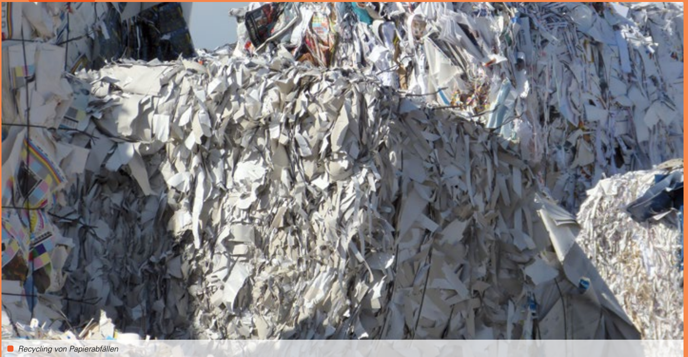
Recycling von Papierabfällen