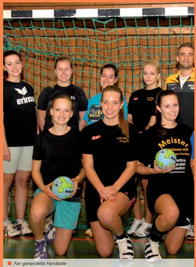
■ Fair gehandelte Handbälle