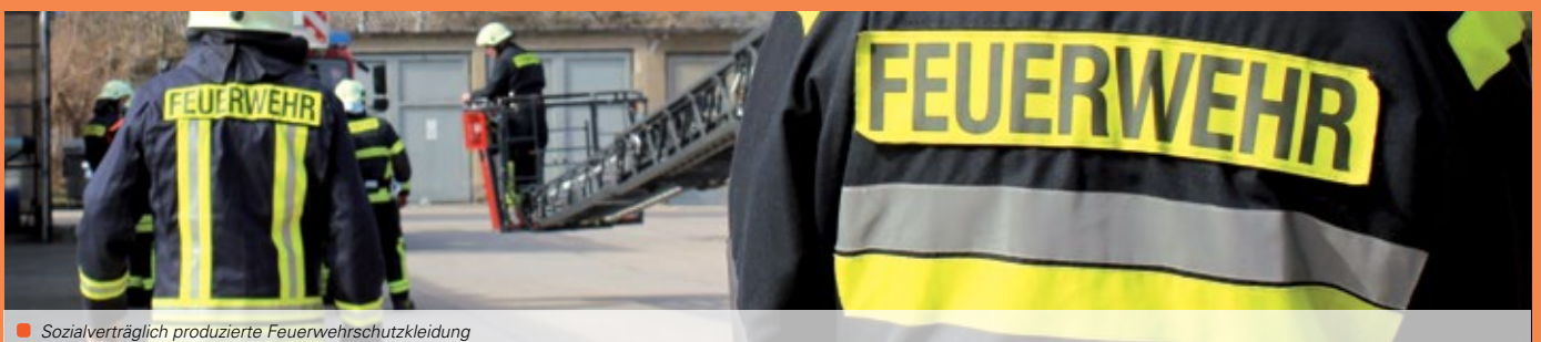
Sozialverträglich produzierte Feuerwehrschutzkleidung

Weitere Informationen: Hauptamt der Stadt Ravensburg, www.ravensburg.de